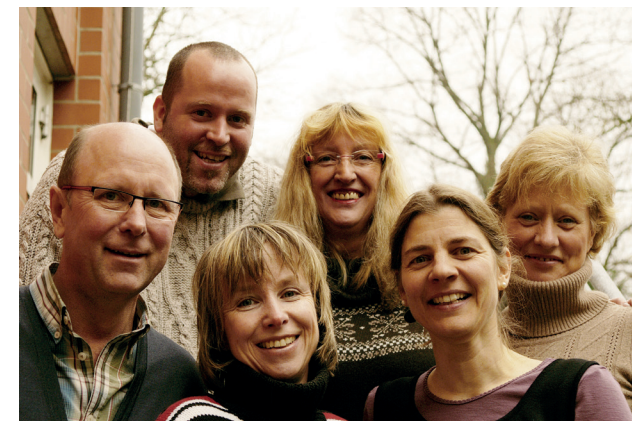
(von links nach rechts:)